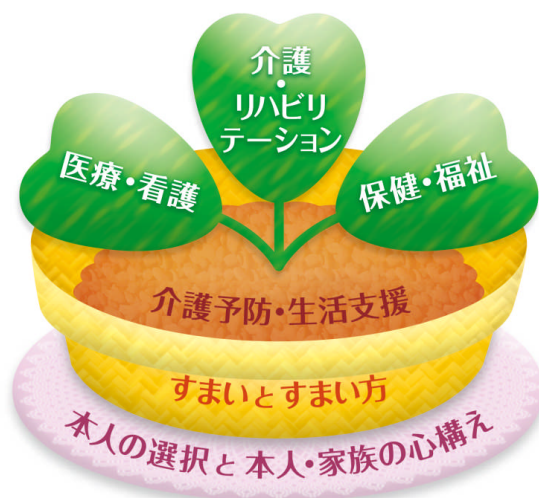
図 1 地域包括ケアシステムの「植木鉢」

2015 年度の研究会報告書では、2040 年を見据えつつ、2025 年までの地域包括ケアシステムの構築を進めるために、自治体に求められる役割である「地域マネジメント」の方向性を議論し、地域の実態把握と課題分析を通じて設定された地域の目標を達成するために、「自助・互助・共助・公助」に基づく「医療・看護」「介護・リハビリテーション」「保健・福祉」「介護予防・生活支援」「住まい」の各資源を発掘・整備し、組み合わせ、ニーズに対応していくことが重要であるとしている。