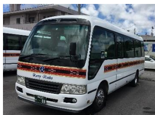
バスの外観 (カーリー観光)